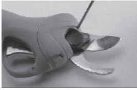
Открутите винты отверткой и откройте крышку