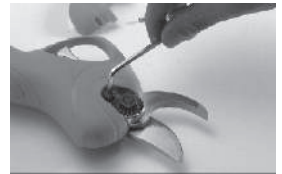
Установите фиксатор гайки

Неподвижный и подвижный ножи можно заменять по отдельности. После замены не бойтесь слишком малого раскрытия ножей. При включении, нормальный размер раскрытия восстановится автоматически.