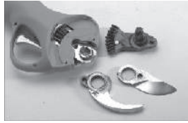
Снимите неподвижный нож