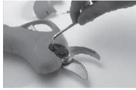
Открутите винты из фиксатора гайки ножа