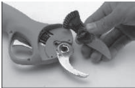
Установите ножи на место