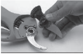
Разберите штифт и извлеките подвижный нож