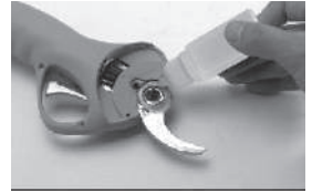
При замене ножей необходимо добавить смазочное масло между ними